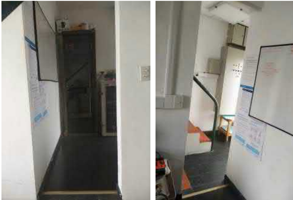
Ubicación puerta desde escalera y sala técnica.